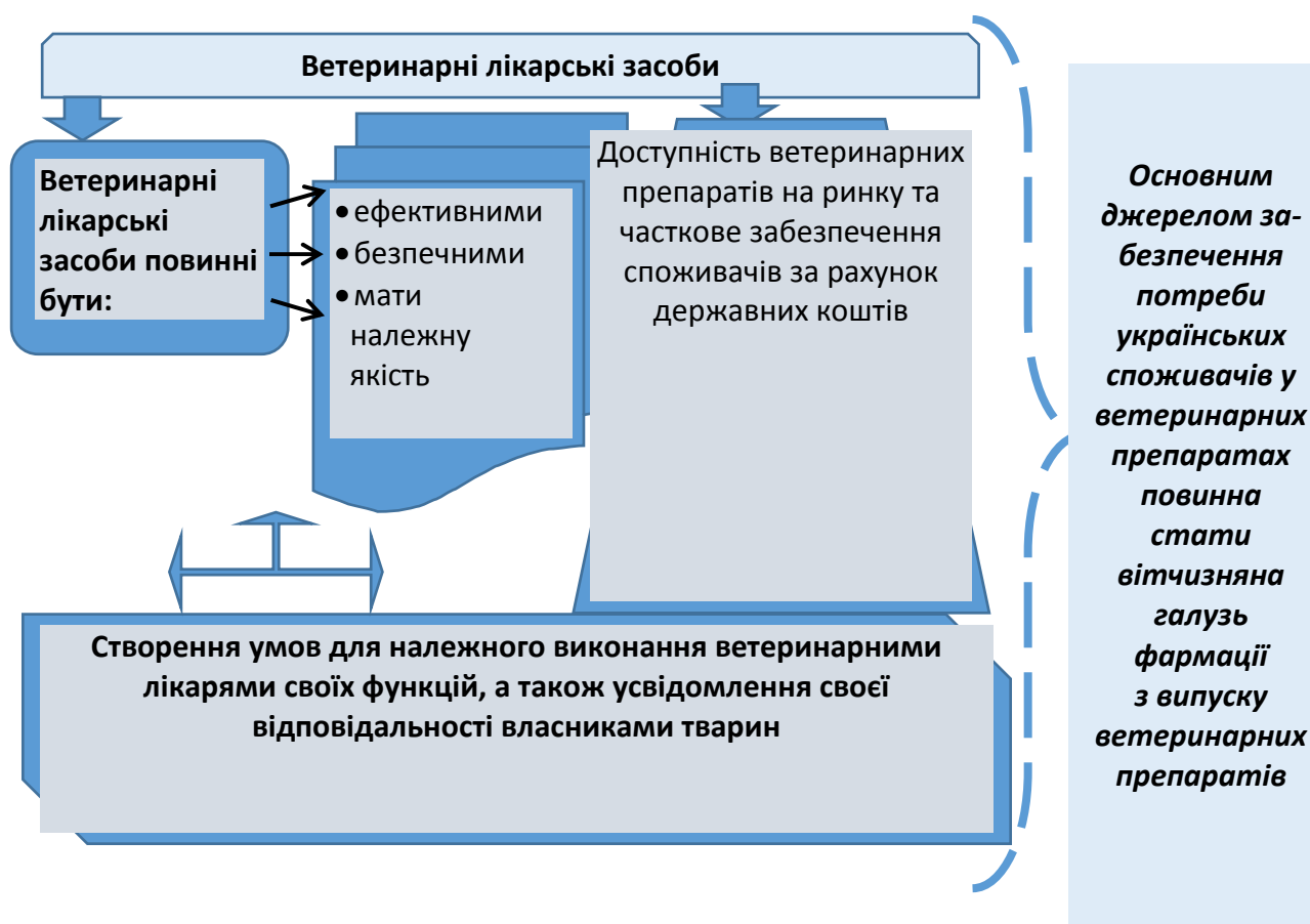
Рис. 1. Вимоги до ветеринарних лікарських засобів

Державна політика у сфері створення та випуску ветеринарних лікарських засобів (ВЛЗ) має базуватися на засадах, які пред'являють певні вимоги до ВЛЗ, а саме (рис. 1):