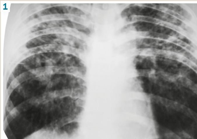
Fig. 1. Plain chest radiograph on day 1 of hospital admission.

laryngeal tuberculosis involving the left vocal cord and the ventricular strip mimicking laryngeal cancer on CT scan and laryngoscopy. A biopsy confirmed the final diagnosis of tuberculosis.