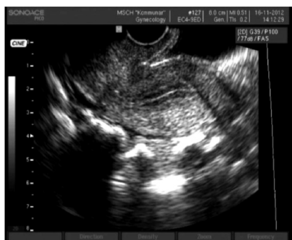
Рис. 8. Пациентка Р., 43 года (после лечения)

При изучении биохимических показателей крови отмечена положительная динамика функциональных показателей печени (табл. 1).