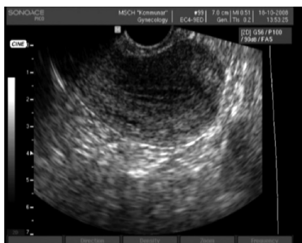
Рис. 7. Пациентка А., 42 года (после лечения)