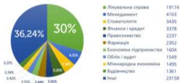
Рис. 4. Трендові спеціальності для іноземних студентів (на 01.01.2016)

5. Зміна попиту на спеціальності. Найбільш престижною для іноземних студентів (40 %) є медичні та фармацевтичні спеціальності. Сегмент інженерно-технічних спеціальностей України потребує підтримки та грамотного маркетингу в глобальному освітньому просторі.