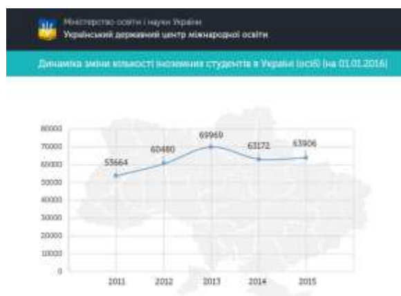
Рис. 2. Динаміка зміни кількості іноземних студентів в Україні (осіб) на 01.01.2016 р. [6].

3. Зменшення кількості іноземних студентів, що навчаються в Україні. За останні 2 роки відбулось зменшення кількості іноземних студентів, що навчаються в Україні. Абсолютні показники зменшення – 6063 (8,7%) осіб [6].