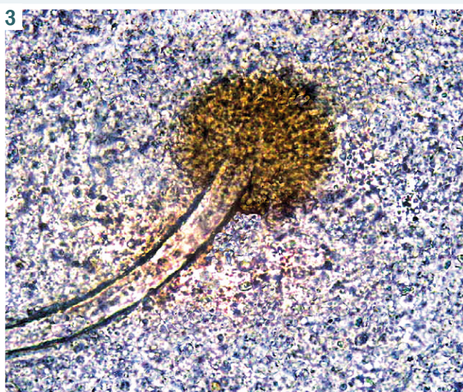
Рис. 3. В мазку – детрит тканин із міцелієм гриба роду Aspergillus . Забарвлення Diff-Quik, 36. x90.

Надійшла до редакції / Received: 12.12.2019