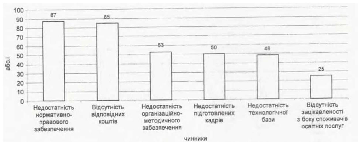
Рис. 3. Кількісні оцінки причин, які заважають розвитку ДО України (за результатами анкетування ВНЗ України III-IV рівня акредитації)

На рис. 3 подано порівняльні кількісні оцінки чинників, які негативно впливають на процес розвитку системи ДО й заважають підвищенню ефективності дистанційного навчання.