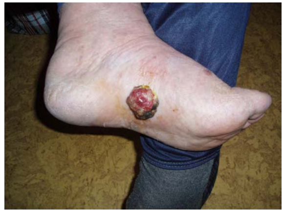
Рис. 4. Саркома Капоши

Різноманітні супутні СНІДу інфекції зачіпають практично будь-яку систему організму. Найбільше поширена і характерна для хворих як в США, так і у Великобританії пневмоцистна пневмонія. Збудниками пневмонії у хворих на СНІД можуть бути і інші організми.