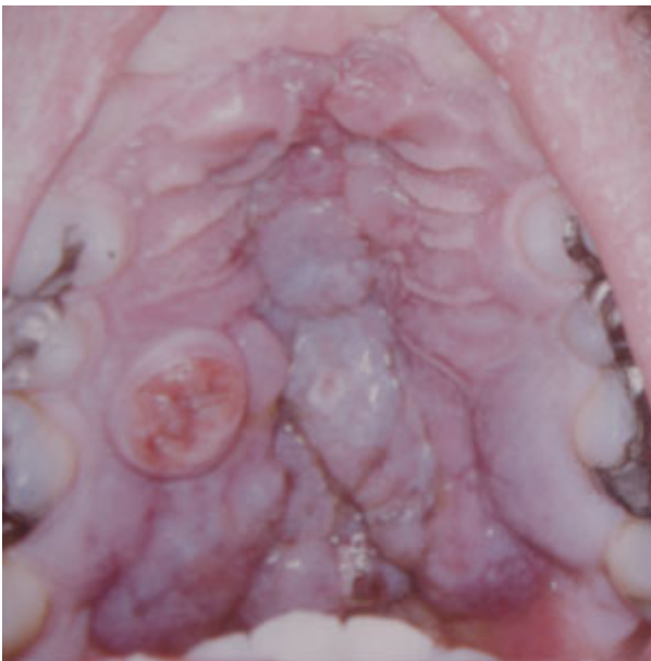
Рис. 7. Саркома Капоши з виразкуваннями і гіперплазією.