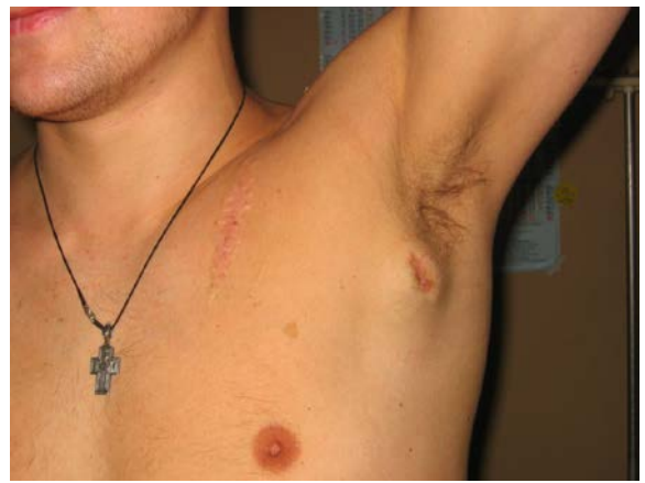
Рис. 10. Збільшення лімфатичних вузлів у хворих на СНІД