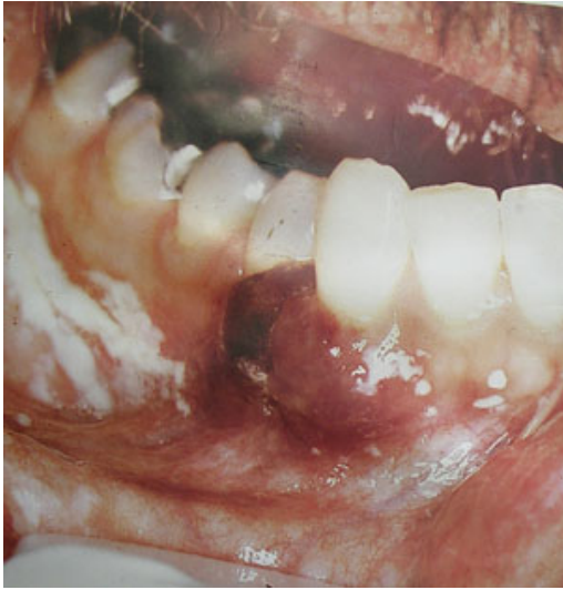
Рис. 8. Саркома Капоши у вигляді епулісу