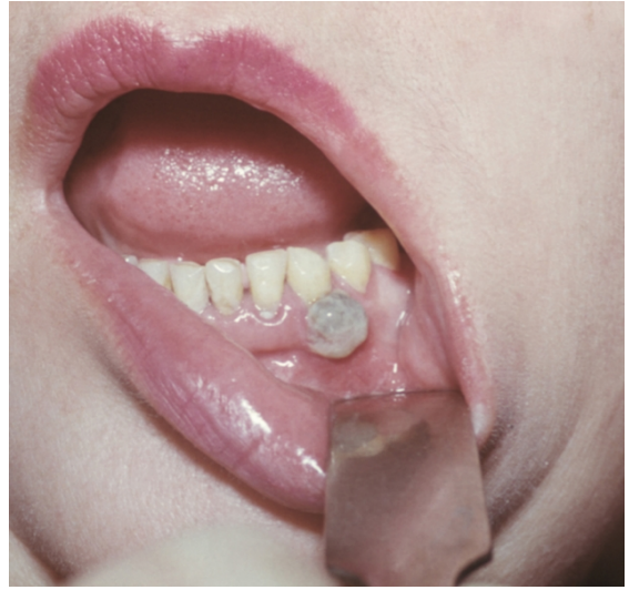
Рис. 9. Ангіоматозний епуліс