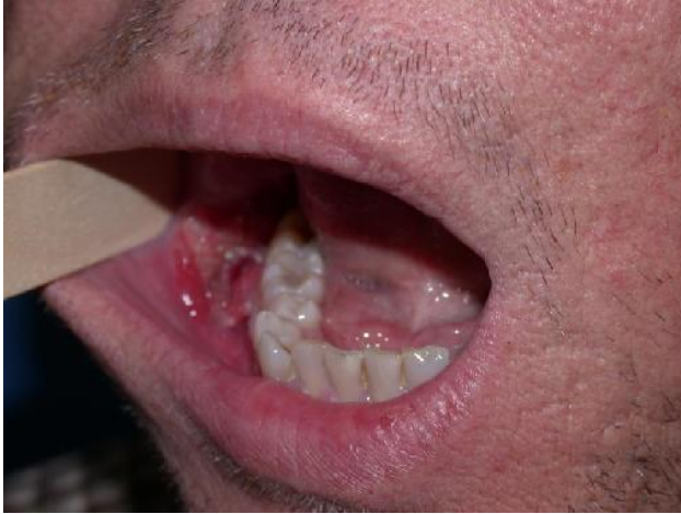
Рис. 3. Плоскоклітинна карцинома ротової порожнини у хворого на СНІД