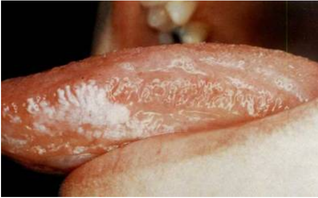
Рис. 5. Волосиста лейкоплакія язика у хворого на СНІД