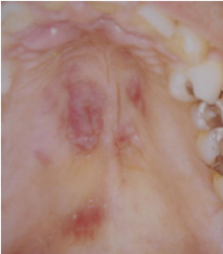
Рис. 6. Саркома Капоши на піднебінні.