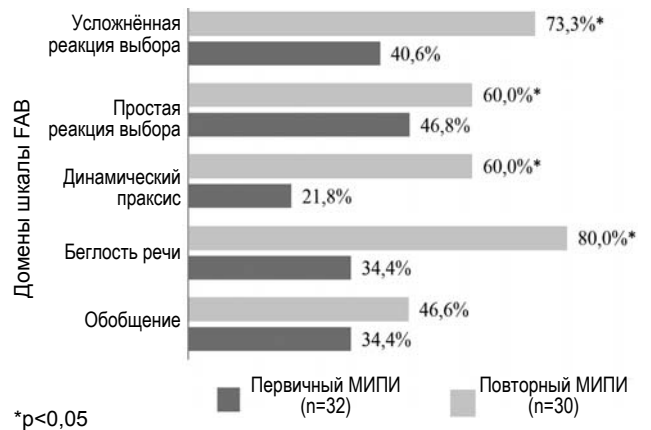
Рис. 2. Доменные особенности КН по шкале FAB в острейшем периоде МИПИ.

Максимальная дефицитарность в выполнении реакций выбора, а также нарушения речи и эфферентная (кинетическая) апраксия, по нашему мнению, носят транзиторный «стрессовый» характер у больных первичным МИПИ, а у пациентов повторным МИПИ имеют вторичный, обусловленный процессами дезорганизации ассоциативных связей (в результате перенесённого инсульта), характер, что приводит к диссоциации между относительной сохранностью произвольного (более простого уровня активности) и нехваткой контроля в регуляции многокомпонентных нейропсихологических процессов.