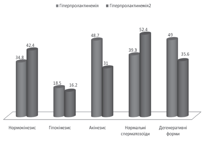
Рис. 3. Якісні показники спермограми в динаміці лікування бромокриптином.

4. На тлі застосування бромокриптину у гіперпролактинемічних чоловіків відбувається стимуляція процесів сперматогенезу з вірогідним приростом в показниках спермограми концентрації та кількості сперматозоїдів ( p < 0,05 ), кількості клітин з нормальною рухливістю ( p < 0,05 ), редукція гіпокінетичних ( p < 0,05 ) та акінетичних ( p < 0,05 ) сперматозоїдів, а також зменшення кількості дегенеративних форм ( p < 0,05 ).