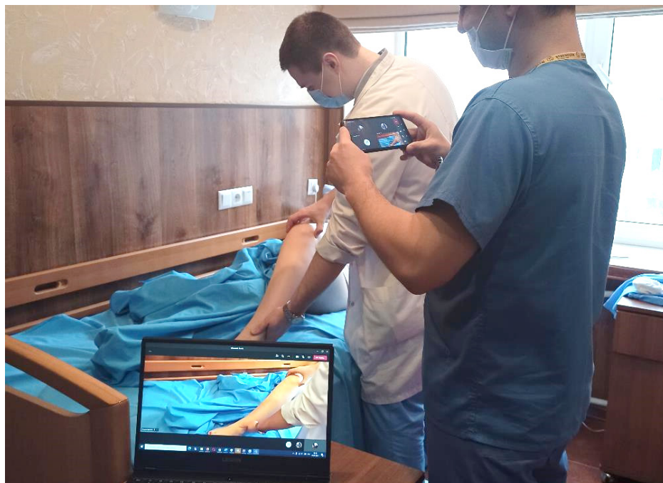
Рис. 2. Вигляд онлайн-демонстрації клінічного обстеження пацієнта.

ходу викладач повертається до кабінету, має змогу завантажити в чат засідання деперсоналізовані дані історії хвороби, рентгенограми тощо та обговорити із учасниками засідання даний клінічний випадок.