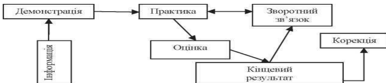
Схема 1. Етапи клінічного навчання

На четвертій сходинці оцінюється ступінь досягнення кінцевого результату, аналізуються яким чином навчальні, технології сприяють підвищенню безпеки пацієнта і покращують якість і ефективність лікувальної установи. Клінічне навчання, що включає оцінку, можна представити у вигляді послідовного ланцюжка.