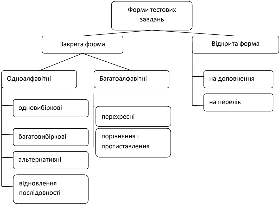
Малюнок 1. Форми тестових завдань за принципами побудови

- об'єктом контролю є не стільки правильність вибору складових частин пристрою або технологічних операцій, скільки послідовність їх взаємодії чи виконання.