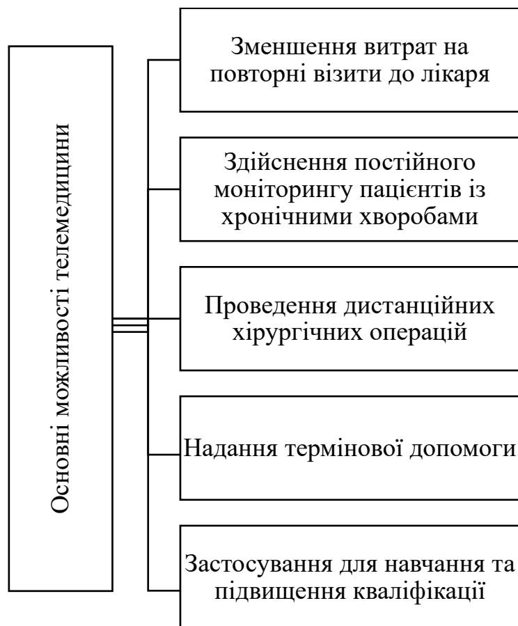
Рис. 2. Основні можливості телемедицини

Розвиток цифрових навичок у майбутніх лікарів також передбачає впровадження телемедицини у сферу охорони здоров'я. Телемедицина використовує цифрові технології для надання медичної допомоги на відстані і для забезпечення зв'язку між лікарями. В електронній системі охорони здоров'я телемедицина є перспективним напрямом надання медичної допомоги. Її можливості та сфери застосування представлено на рисунку 2.