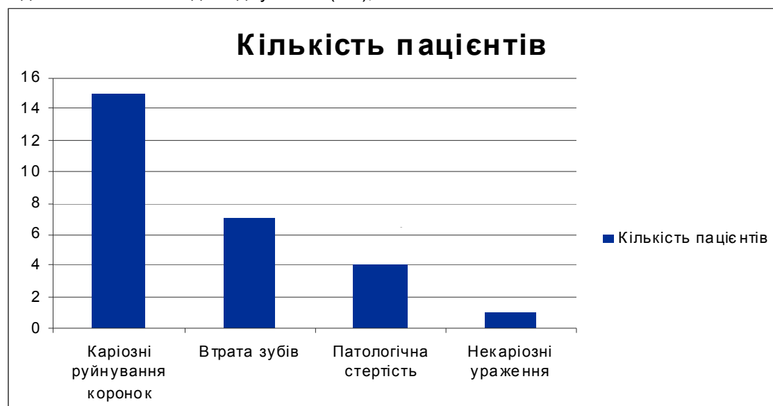
Рис. 2. Графік поширеності оклюзійної патології серед пацієнтів із вадами лінгвомоторики.

некаріозні ураження – в 1 пацієнта (2%), ортопедичні знімні та незнімні конструкції, що не відповідають клініко-лабораторним вимогам, були виявлені у 23 пацієнтів (46%).