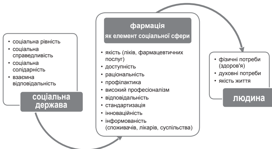
Рис. 1. Реалізація фармацевцією принципів соціальної держави (джерело: власна розробка).

Фактор здоров'я, що є пріоритетною соціальною цінністю та найважливішим економічним ресурсом суспільства, в сучасному світі є індикатором прогресу соціально-економічного розвитку, в якому синтезується досягнутий рівень якості життя людей та економічного