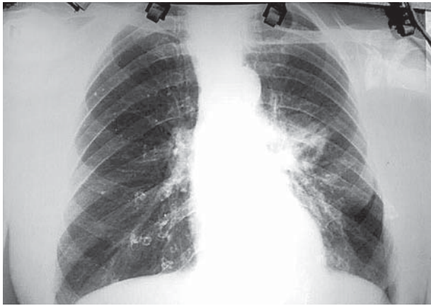
Рис. 1. Рентгенограмма органов грудной полости от 13.03.2013 г. В S VI левого легкого неправильной формы с неравномерной толщиной стенками полость распада 2,0 на 2,5 см, связанная с корнем легкого. Структурность корня снижена