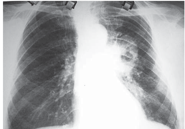
Рис. 4. Рентгенограмма органов грудной полости от 07.05.2013 г.