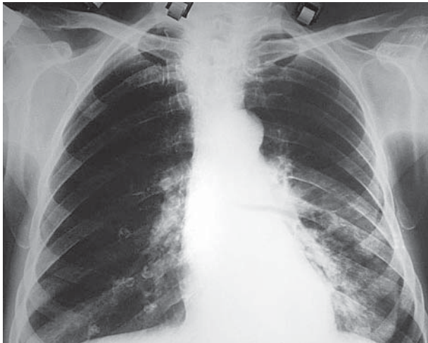
Рис. 6. Рентгенограма органів грудної порожнини від 21.05.2013 г.

27.05.2013 г. больна проконсультувана в онкологічному диспансері. Из заключения: «Рентгенологічно не можна категорично виключити периферический рак с распадом. Кавернозний туберкульоз нижньої долі лівого легкого (?)».