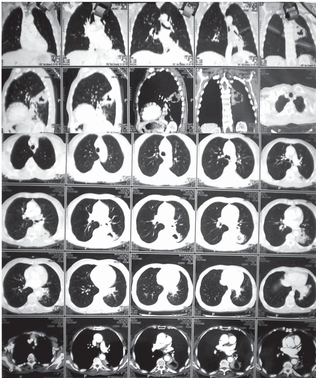
Рис. 5. Компьютерная томография легких от 14.05.2013 г.

том бронхиального дерева через неравномерно суженные субсегментарные бронхи V_{VI} . По ходу бронхосудистого пучка нижней доли левого легкого отмечается патологическая тяжесть в виде «муфт» с развитием ателектаза S_{VIII} . Органы средостения нерезко смещены в сторону поражения. Отмечается увеличение лимфоузлов средостения: нижней паратрахеальной группы — до 12 мм, левой трахеобронхиальной и аортопуль-