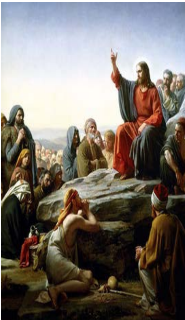
Карл Блох «Нагірна проповідь»