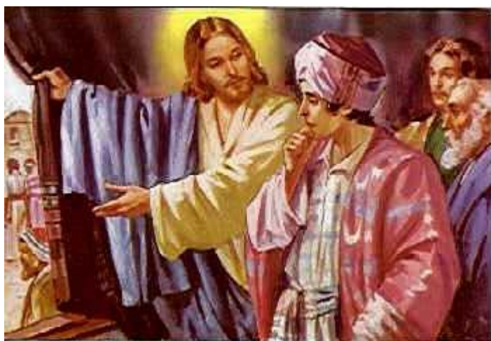
Ісус Христос і багатий юнак з притчі «Про багатого юнака»

Відомий вислів з притчі Про багатого юнака – «Легше верблюдові буде пройти крізь вушко голки, ніж багатому увійти до Царства Небесного» – деякі коментатори Євангелія пояснюють алегорично, зокрема так: 1) верблюд – це товстий канат, виплетений з верблюжої шерсті, і його справді неможливо втягти в голку; 2) вушком голки жителі Єрусалима називали одні з міських воріт, які були надто низькі й вузькі, щоб пропустити караван верблюдів. Тобто вислів означає, що зробити щось буде «надто важко, майже неможливо».