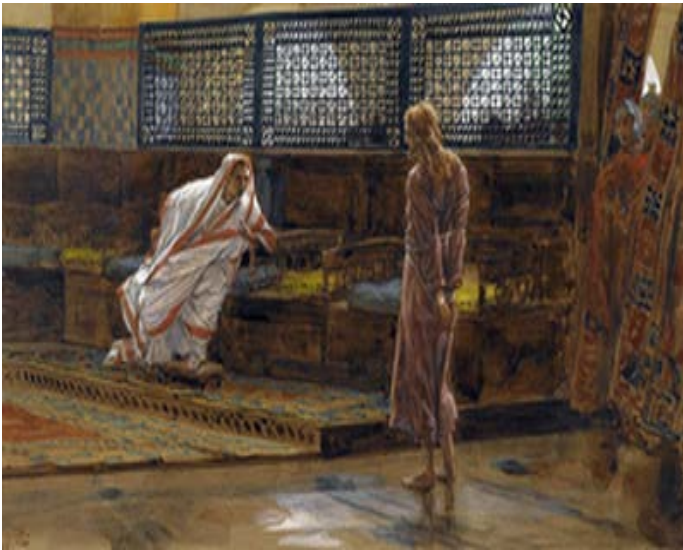
Джеймс Тіссо «Суд Пілата»

Як відомо, Олена Булгакова – дружина М. Булгакова, автора роману «Майстер і Маргарита», сказала, що для того, щоб добре зрозуміти цей твір, не можна забувати про те, що М. Булгаков – син професора богослов'я і до того ж – онук священників.