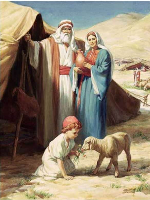
Авраам і Сарра

Прихильники сурогатного материнства стверджують, що ця біотехнологія має аналог у Біблії, зокрема в Старому Заповіті. При цьому мають на увазі життя Авраама, Сарри та її рабині Агарі або, наприклад, життя Іакова зі своїми дружинами Рахиллю і Лією та їх служницями Валлою і Зелфою. Якщо коротко передати суть цих історій, то вони зводяться до того, що законні дружини, коли не могли мати дітей, просили своїх чоловіків «увійти до служниць», щоб ті могли зачати та народити дитину, а потім дати цю дитину законній дружині «на коліна», щоб вона теж вважалась матір'ю дитини і брала участь у її вихованні.