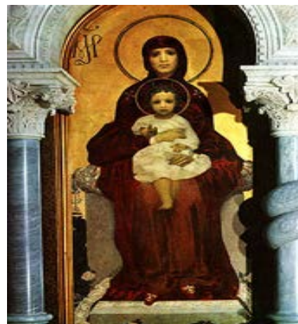
М. Врубель «Богородиця з дитям»

М. Врубель творив у фарбах і Христа, і Богоматір, однак дослідники відзначають, що обличчя Матері Божої (ікона з іконостасу Кирилівської церкви в Києві) дуже нагадує риси земної жінки – Емілії Прахової, яка була нерозділеним коханням М. Врубеля і водночас дружиною Адріяна Прахова, який керував групою художників, що здійснювала розпис Володимирського собору (М. Врубель, В. Васнецов, М. Нестеров). Це нерозділене кохання також було однією з причин, що посилювали його душевну хворобу.