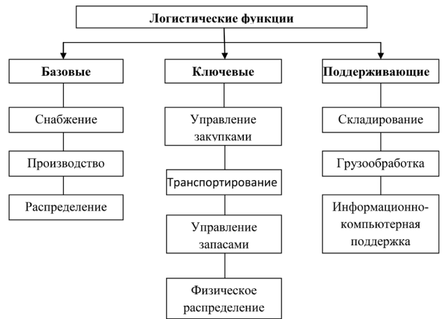
Рис. 1. Функции логистической системы

Важной для достижения экономической эффективности при организации и предоставлении ЭМП пострадавшим в ЧС является логистика запасов («резервов»).